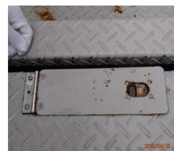
消火口ヒンジ破損箇所