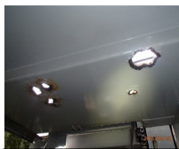
パレット腐食に箇所