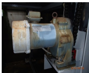
昇降モーター異音