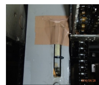
落下防止キャッチプレート固定