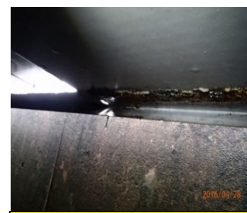
パレット隙間塞ぎ腐食箇所